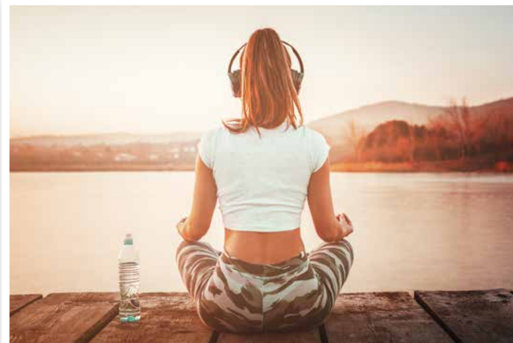
Meditation handlar om att vara närvarande just i detta ögonblick.