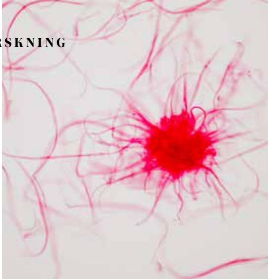
Cancercell i mikroskop.