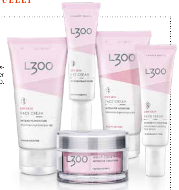
Hudvårdsprodukter från L300.