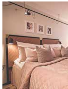
Förhoppningen är att rummet ska bokas ofta.

att de får äran att bo i vårt rosa rum, till förmån för Bröstcancerförbundet.