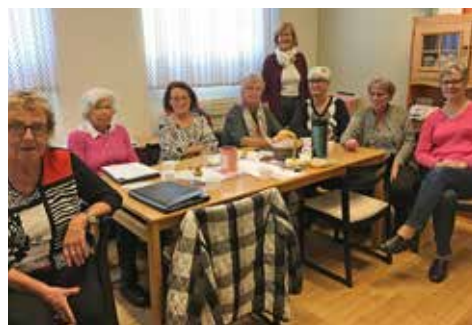
Styrelsen i Bröstcancerföreningen Blåkulla Oskarshamn lärde känna varandra på djupet.